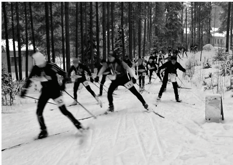
Hiihtosuunnistuksen SM-sprinttaviestin yhteislähtö

Päijät-Rasti Padasjoki - Kuhmoinen www.paijat-rasti.net